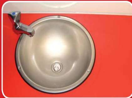
Edelstahlwaschbecken mit Armatur