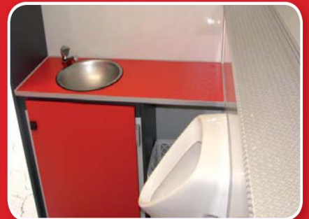
Hygienebereich mit Stauschrank