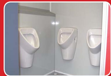
Herrenabteil mit Pissloirs